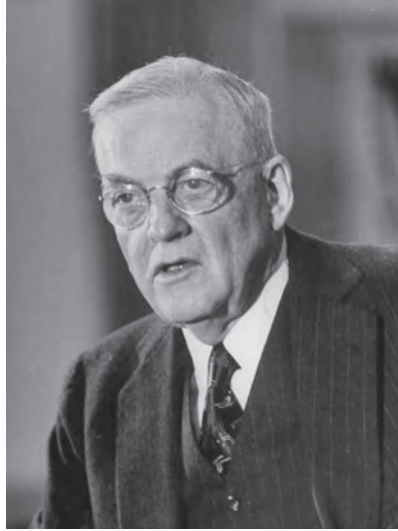
شكل ٥-٢: جون فوستر دولز. 2

الهادي، فما كان من دولز إلا أن صرح بأن مخاوف سبيندر من اليابان مغالً فيها؛ فكان جواب سبيندر هو أن أوجه اعتراض دولز على إبرام المعاهدة مجرد أوهام، ورغم هذا اتفق دولز مع سبيندر على وجوب التوصل إلى تسوية.