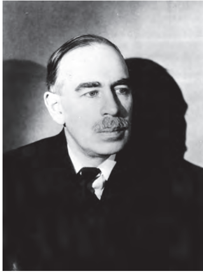
شكل ٣-٤: جون ماينارد كينز. 4

وكان مما أثار قلق كينز أيضًا، أن بريطانيا لم يسبق لها من قَبْل أن فرضت تعويضات واسعة المدى كهذه؛ إذ وفقًا للاتفاقية، حُوِّل للجنة التعويضات الحصول على خمسة مليارات دولار أمريكي من ألمانيا في أي صورة (نقود سائلة، أملاك، مواد خام) بحلول مايو من عام ١٩٢١. وكما قال كينز معترضًا «فإن هذا الشرط أوكل إلى لجنة التعويضات سلطات ديكتاتورية للفترة سالفة الذكر تتحكم بها في جميع أملاك ألمانيا بأي صورة كانت.» لكن تبين أن هذا ليس إلا أول فاتورة تدفعها ألمانيا من قائمة ديون ضخمة وغير واقعية تدين بها لقوات الحلفاء، كما توقع كينز أن تشهد ألمانيا فترة كساد اقتصادي كبير نتيجة للمعاهدة، يفقد على أثرها الكثيرون وظائفهم، ويهلك بسببها الكثيرون بما سببته خطط قوات الحلفاء للسلام من تضيق للخناق على اقتصاد جمهورية فايمار. بدا بالفعل لكينز أن صانعي السلام قد سعوا عامدين إلى تدمير ألمانيا، فيقول: «البنود الاقتصادية بالمعاهدة شاملة، ولم يُعْض الطرف بها عن أي شيء قد يتسبب في إفقار ألمانيا في وقتنا الراهن أو يعرقل تقدمها في المستقبل.» وفي النهاية نوه