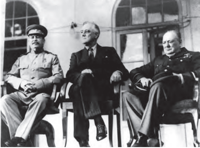
شكل ٤-١: قادة الدول الثلاث الكبرى في اجتماع طهران عام ١٩٤٣: تشرشل وستالين وفرانكلين دي روزفلت. 1

مباشراً يهدد بتقويض جهودنا الحربية المشتركة. لقد توصلنا إلى خطة عمل جيدة جداً فيما يتعلق بكل هذه البلدان، كلٌّ على حدة، ومجمعة معاً؛ وذلك بهدف تركيز كل جهودها وتنسيقها لتتوافق مع جهودنا في مواجهة العدو المشترك والتأسيس — قدر الإمكان — لتسوية سلمية.