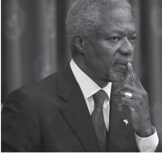
شكل ٦-١: كوفي أنان. 1

الموارد البشرية والطبيعية على نحو أكثر فعالية؛ لأن المرأة تميل إلى ضمان المساواة في تقسيم الموارد المقدّمة إلى المجتمع، والتأكد من الاستفادة من دروس التنمية ونقلها إلى الأجيال القادمة، إلا أن مؤيدي المساواة بين الجنسين يواجهون معارضة قوية في المجتمعات التي تُحرّم فيها المرأة من الالتحاق بمستويات التعليم العليا ومن العمل؛ إذ تُستغلّ «القيم التقليدية» في العديد من أنحاء العالم لتبرير إقصاء المرأة. وليس الأمر مسألة صراع بين المحافظة الدينية والحدّات العلمانية؛ ففي العديد من الدول الإسلامية الحديثة، ومن بينها ماليزيا على سبيل المثال، تُشكّل الفتيات غالبية الطلاب في مرحلة التعليم بعد الثانوي. فالأمر يتعلق بالأحرى بالتقاليد الراسخة والهيمنة الذكورية والتخلف الاقتصادي؛ وهي عوامل تتعلق بالأنظمة ككل، وقد يستغرق هدمها عدة عقود. يرى البروفيسور رولاند باريس أن مفهوم الأمم المتحدة الواسع للأمن البشري بنطاقه الشامل من القضايا التي تضمّنّها يحمل مخاطرة؛ وهي أنه ربما يشكل عبئاً ثقيلاً يمنعه من أن يكون تعريفاً قابلاً للتطبيق. في التقرير الذي أصدره المركز الكندي للأمن البشري بجامعة كولومبيا البريطانية عام ٢٠٠٦، عمل الباحثون على تضيق