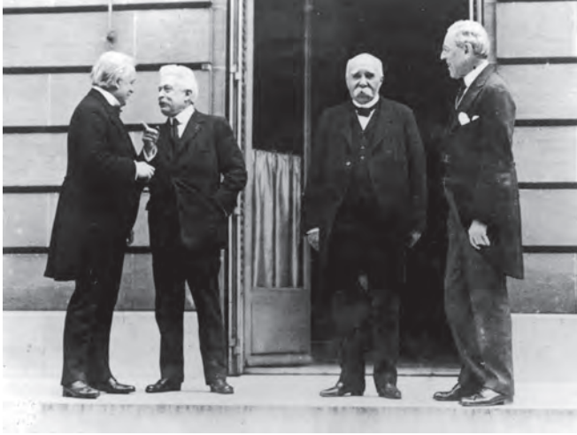
شكل ٣-٣: قادة الدول الأربع الكبرى في فرساي: وودرو ويلسون، ولويد جورج، وجورج كليمنصو، وفيتوريو أورلاندو رئيس وزراء إيطاليا. 3

وكان هذا يعني أن الشعب الألماني تحمّل وحده — ووحده تمامًا — المسؤولية عن الحرب الأكثر دمارًا في التاريخ، رغم الأسباب المختلفة التي أدّت إلى نشوب الحرب، ورغم تبرؤ الشعب الألماني من القيصر وتأسيس ديمقراطية برلمانية.