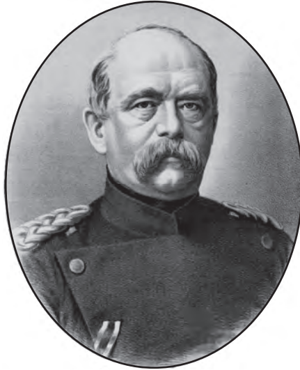
شكل ٣-٢: الأمير أوتو فون بسمارك. 2

عندما أسس المستشار الألماني أوتو فون بسمارك الرايخ الألماني عام ١٨٧١، أتى هذا بالدرجة الأولى على حساب فرنسا في حرب التوحيد الثالثة. تعرضت فرنسا لإذلال وحشي؛ فقد وقع الإمبراطور الفرنسي في الأسر ثم نُفي إلى الخارج، ووقعت البلاد تحت احتلال جزئي، وتعيّن عليها دفع تعويضات حرب جسيمة، وخسرت إحدى مقاطعاتها الهامة؛ وهي منطقة الألزاس واللورين التي أصبحت تُدعى «المقاطعة الإمبراطورية» إلى أن استعادتها فرنسا بعد الحرب العالمية الأولى. وكان من شأن هذا الخزي الذي تعرضت