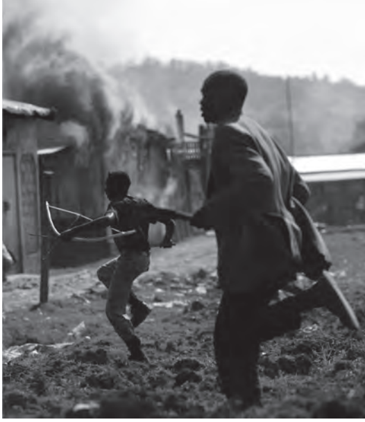
شكل ٦-٣: الاضطرابات المدنية في أفريقيا: رجلان من قبيلة «كيسي» يجريان في حقل بينما يحاربان مجموعة من سكان قبيلة «كالينجين» في بلدة شيبيلات غربي غينيا في الثالث من فبراير عام ٢٠٠٨. 3

وهي أكبر منظمات الأمن الأوروبي، من حيث إنها تتضمن روسيا بوصفها خليفة للاتحاد السوفييتي. وبالإشتراك مع منظمة حلف شمال الأطلسي (الناتو)، التي تتضمن الولايات المتحدة الأمريكية، تطورت مهمة منظمة الأمن والتعاون في أوروبا لتتحول من وسيط للحوار في مجال تحقيق الأمن البشري ومنظمة داعمة للديمقراطية إلى العمل في مجال حفظ السلام. وترى الباحثة السياسية نينا جرايغر والخبيرة في مجال الأمن والسلام أليكساندرا نوفوسلوف أنها «المنظمة الأهم في إرساء المعايير في أوروبا». رغم أن فاعليتها هذه يقوّضها التنافس الاستراتيجي المتجدد بين الولايات المتحدة الأمريكية وروسيا. باختصار، تُعزّز العولمة من كفاءة الروابط بين الدول المتعددة، غير أنها تجعل المجتمعات القومية عُرضة لمجموعة أكبر من الصدمات الدولية والمخاطر الأمنية. وعلى