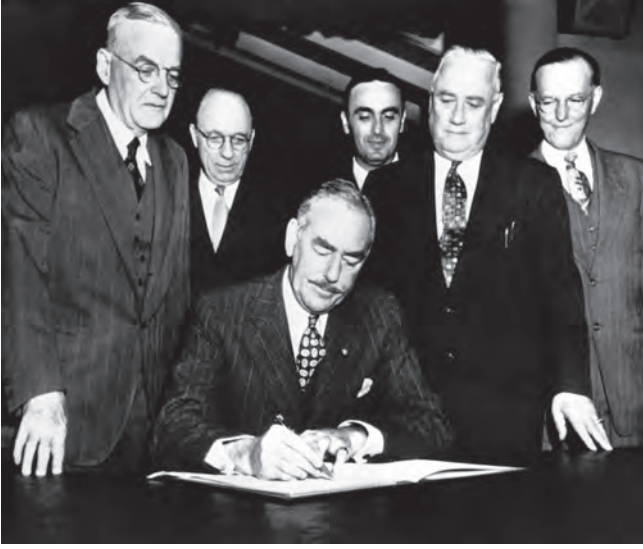
شكل ٥-٣: توقيع معاهدة أنزوس في سان فرانسيسكو عام ١٩٥١. 3