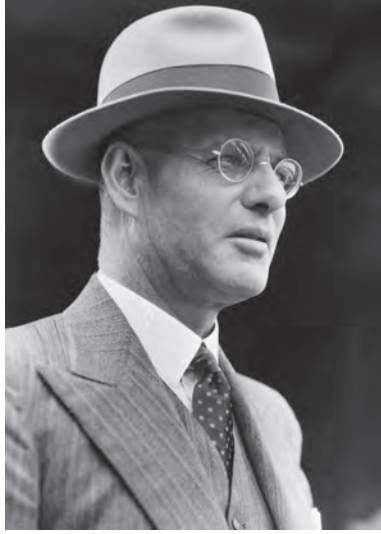
شكل ١-٥: جون كيرتن. 1