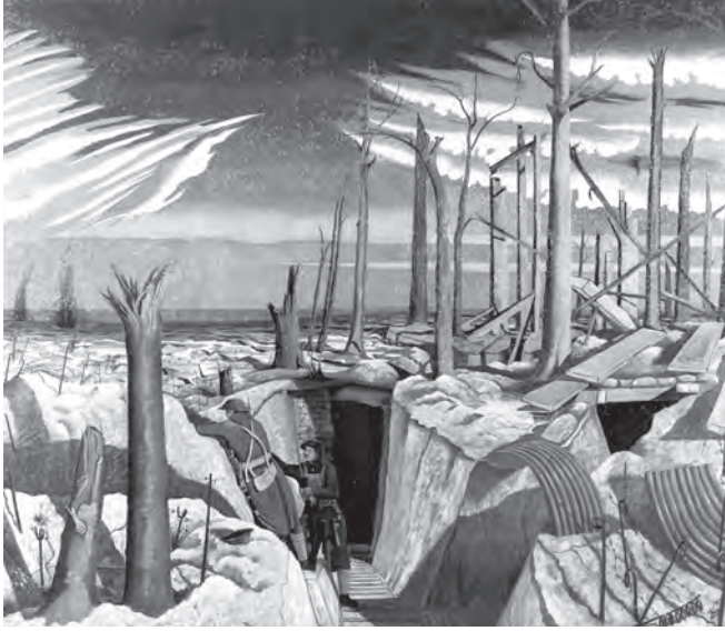
شكل ٣-١: حرب الخنادق: الاستيلاء على الغابة الواقعة غرب بلدية أوبي (١٩١٧)، بريشة الفنان جون ناش. 1

الجيش؛ مما كان يعني بالأساس أن يتولى الملك مسئولية وضع السياسات كافة، وأنه إذا رأى أن خوض حرب ما يشكل ضرورة لأسباب تتعلق بالدولة، فإنه يفوض الجيش للتخطيط للحرب وخوض غمارها. وبهذه الطريقة، كان من المفهوم إمكانية تأمين الحماية القصوى للبلاد. وقد لعبت أسرة هوهنتسولرن على جميع المستويات المهمة دورًا مؤثرًا في تشكيل الثقافة السياسية البروسية الألمانية التي امتدت حتى نهاية الحرب العالمية الثانية.